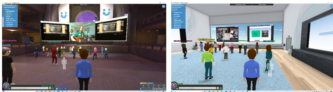
3D platform GoMeet

Wij zien met online events die wij moderaten en technisch begeleiden mensen enorm enthousiast worden van eens een keer een andere online omgeving. Het brengt een nieuwe sprankel met zich mee!