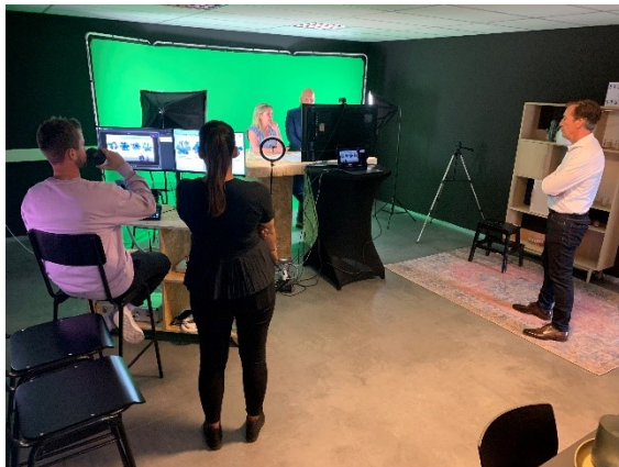
Effectivents Studio – moderating online webinar

Maar ja... ook dit is vanuit de on site situatie niet nieuw; soms volstaat een eenvoudige functionele vergaderruimte en in andere gevallen is vanuit de eventdoelstelling iets verrassends, unieks, groots, sprankelends gewenst om van een echte beleving te kunnen spreken.